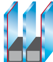
3-fach Isolierglas mit zwei unsichtbaren Wärmedämmbeschichtungen aus Edelmetall.